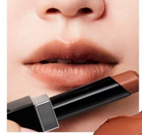
B108 Timeless Honor 時代を超えた気品を 漂わせるティープラウンが、 しなやかな表情を引き出すタイムレスオナー