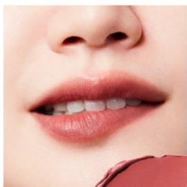
B101 Clove Warm 深みをスパイスにした肌になじむ ベージュレッドが、こなれた表情に みせるクローブウォーム