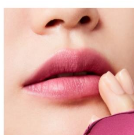
EX2 Spring Has Come 〈限定〉 春の訪れを告げるライラックモーヴが、 煌めきとともに儂げな表情をみせる スプリングハズカム