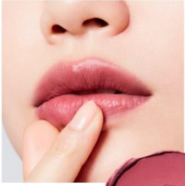
B105 Nostalgic Mauve くすみを効かせたまるやかな ピンクモーヴが、憂いを帯びた 可憐さを添えるノスタルジックモーヴ