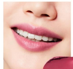
B104 Harvest Rose 咲き誇る花に囲まれるように 華やかなローズカラーが、情緒まで 豊かに彩るハーベストローズ