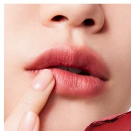
B103 Gentle Red じんわり滲む穏やかなレッドが、 佇まいに秘められた情熱を 醸し出すジェントルレッド