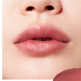
B106 Raw Rose Bud 湿度を纏った蕾のような ローズベージュが、イノセントな ムードに誘うロウローズバッド