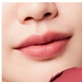
B102 Blissful Breath やわらかく寄り添う レッドピンクが、至福を感じて こぼれる吐息を想わせる プリズフルプレス