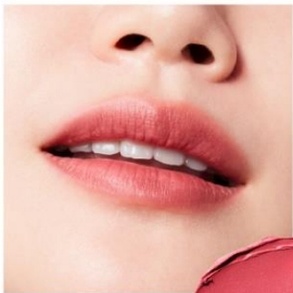
EX1 Melodious Coral 〈限定〉 うらかな陽気を彷彿とさせる鮮やかな コーラルが、晴れやかな表情に彩る メロディアスコーラル