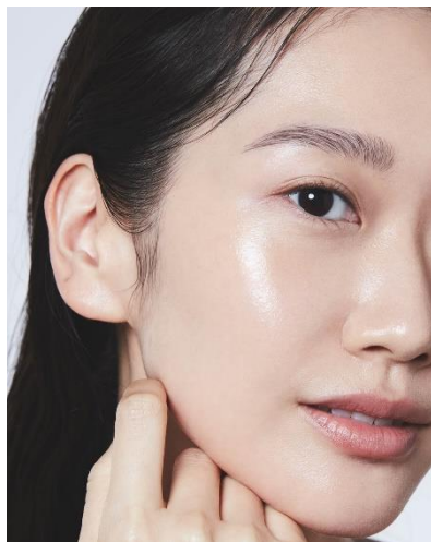
カネボウ ライブリースキン ウェア 仕上がりイメージ

ファンデーションでつくった自分らしい肌、その仕上がりをそのままに、より美しく保つことができないか。今回KANEBOより、ファンデーションで仕上げた質感・色を生かしながら、明るくなめらかな美しい仕上がり、しっとりとした心地よい肌感触が続くプレストパウダーが新登場。粉体をジェルで包み込んだようなうるみ膜が光を取り込む「デュアルジェルコーティング技術」を搭載。ファンデーションの仕上がりを生かすやわらかな光感で、毛穴を目立たなくし、肌のキメをふっくらと見せ、顔全体のトーンを明るく整えます。