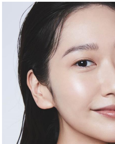
カネボウ ライブリースキン ウェア+ カネボウ クリスタライズドフィックスパウダー 仕上がりイメージ