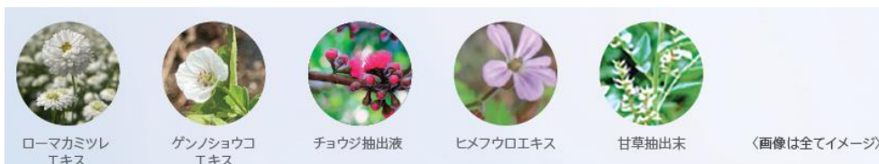
〈画像は全てイメージ〉

(保湿:ローマカミツレエキス、ゲンノショウコエキス、チョウジ抽出液、ヒメフウロエキス、甘草抽出末)