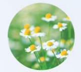
カモミラET 〈画像はイメージ〉

紫外線を浴びると生じるエンドセリンによるメラニン生成の情報伝達を抑制することで、メラニンの生成を抑え、シミ・ソバカスを防ぎます。