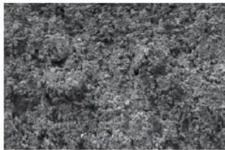
カラーメンテナンス (S) の塗膜表面 (微細な凹凸形状)