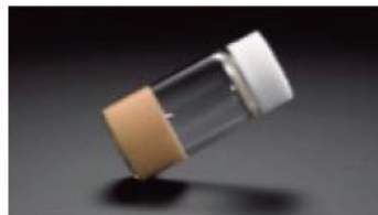
カラーメンテナンス (S) に採用の 粒径の小さい酸化亜鉛

皮脂を粉体内に留める効果のある粒径が小さい酸化亜鉛によって皮脂を塗膜内に固定化します。