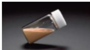
当社従来品に採用の 粒径の大きい酸化亜鉛