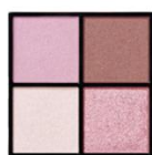
EX-7 チュチュライラックポップ