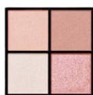
EX-6 チュチュピンクポップ