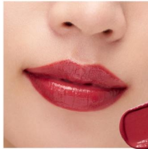
D205 Royal Red 奥行きを感じさせながら強さもあるレッドで、 堂々とした表情に 品格をたたえるディープレッド