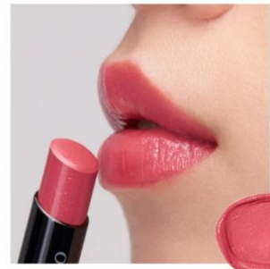
EX2 Spicy Pink 〈限定〉 パールを織り交ぜた鮮やかな色合いが、 ピュアな乙女心を宿し、 可愛い表情を引き立てる コーラルピンク