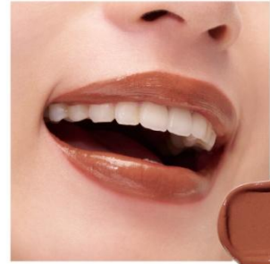
D206 Soul Brown 落ち着いた中に奥底からの血色を潜ませた、 魂揺さぶるレッドブラウン