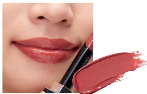
D202 Simple Red 赤の魅力である、シックさとチャーミングさがシンプルに伝わり、表情と心に晴れやかさを与えるコーラルレッド