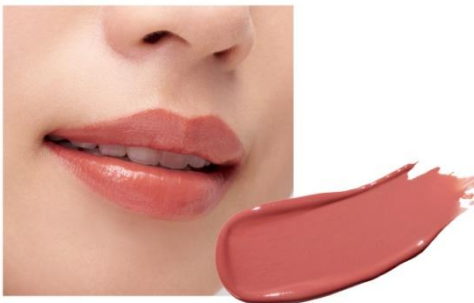
D201 Melodious Beige 明るさと温もり感のある心地よいカラーで、表情と気持ちに軽やかさをもたらすピンクベージュ