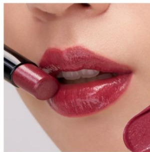
EX1 Galactic Red 〈限定〉 星空を思わせる大小の煌めきが 大人心をくすぐる、 シックな中にも遊び心を感じる ボルドーレッド