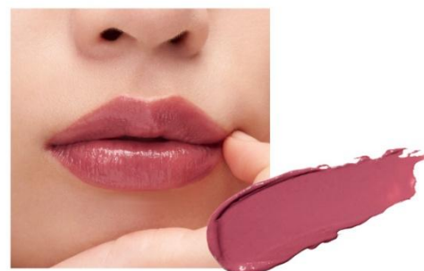
D203 Red with Love 血色感の赤と奥ゆかしさのローズの掛け合わせで、穏やかさの中にエモーショナルな表情が見え隠れするローズレッド