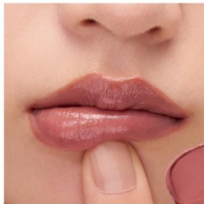
D207 Unconditional Red 黄みと青みの絶妙なバランスのカラーが、 無条件の愛を思わせ、 優しさと強さを与えるフィグレッド