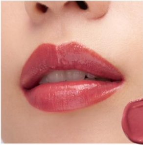
D204 Sophisticated Red なじみのよいレッドでありながらも、 心まで鮮明に色めき立ち、時と表情が 研ぎ澄まされるようなダスティレッド