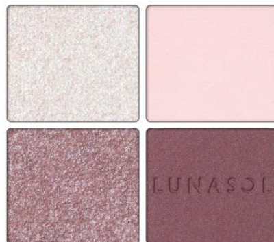
EX16 透き通る光に溶け込む青みニュアンスが神秘的なミスティッククラリティ