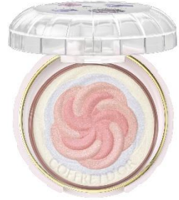
EX-03 グロッシーパーステル