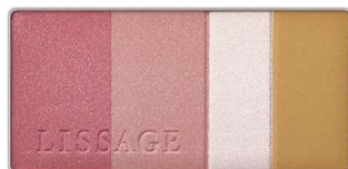
RS-1 (ローズ系) エレガントな印象