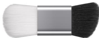
チーク・ ハイライト用 シェーディング用