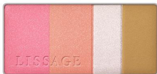
PK-1 (ピンク系) 可愛い印象