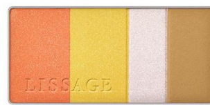
OR-1 (オレンジ系) 前向きな印象