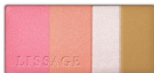
チーク ハイライト シェーディング