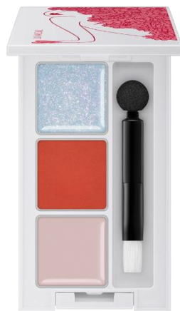
EX02 : I Got You