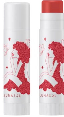
EX02 : Blossom Lover