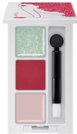
EX01 : Chartreuse Berry

華やかに輝くスパークル、 ソフトマットに色づくパウダー、 濡れたようにつやめくグロウ。 異なる3種の質感を楽しむモード なリップパレット。