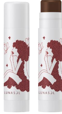
EX03 : Blueberry Fizz