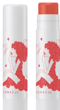
EX01 : Pure

カジュアルに塗って、シアーに色づく。 とろけるような感触で みずみずしくうるおうリップバーム・唇用美容液。