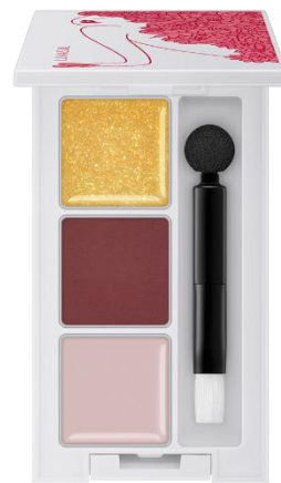
EX03 : Star Picking