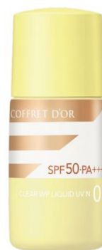
01 明るめの肌の色 (オークル-B相当)