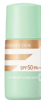
03 健康的な肌の色 (オークル-D相当)