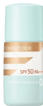
02 標準的な肌の色 (オークル-C相当)