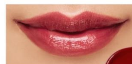
113 Black Ruby