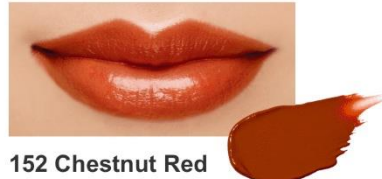
152 Chestnut Red