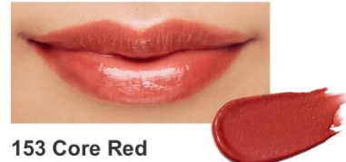
153 Core Red