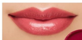
112 Old Rose