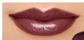
EX1 Wicked Queen