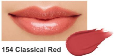
154 Classical Red