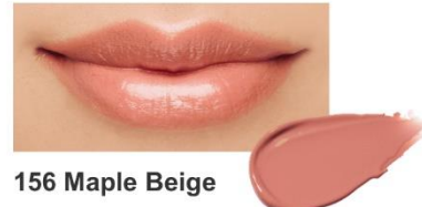
156 Maple Beige