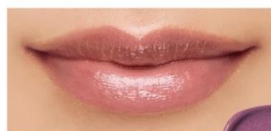
114 Mystical Orchid