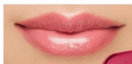
111 Eden Pink