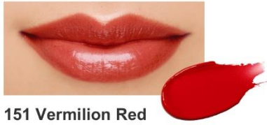
151 Vermilion Red