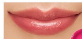
EX2 Princess Wink