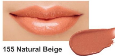
155 Natural Beige