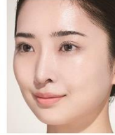
カラーチューニングUV PU 塗布