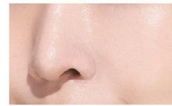
PU塗布経時後の肌状態 <イメージ>