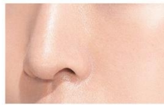
当社従来品※ <イメージ>