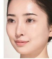
カラーチューニングUV AP 塗布