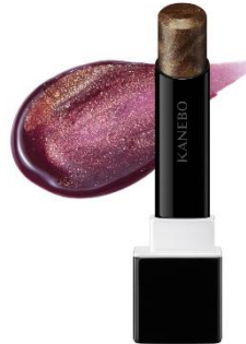
EX6 Burgundy Moire（限定） 深い色みとゴージャスな輝きのコントラストで、 唇に宝石を添えるようにツヤめくバーガンディ×スパークルゴールド