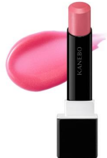
EX4 Tint Pink（限定） ピュアでクリアな無垢血色ピンク