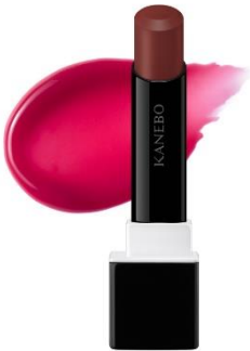
301 Tint Redwood 自然な紅潮感を纏う純血色レッド