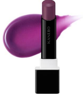
EX3 Tint Ice Mauve（限定） 冷たさとはかなさを感じる可憐血色モーブ