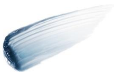
EF1 Tanzanite Blue 夜空を閉じ込めたような透明感あふれる高貴な群青色。 眉の存在感を際立たせ、ツヤと立体感を与えます。