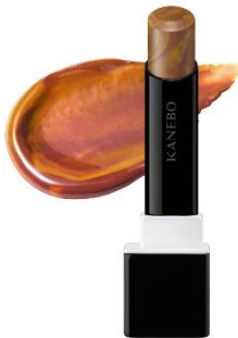
EX5 Chestnut Moire（限定） 樹木に注がれる太陽の光のように、ぬくもりと力強さのある チェスナットブラウン×クロムイエロー