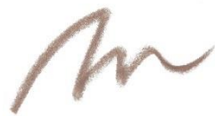
EP2 Shade Brown