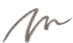
EP1 Shade Gray

上下の毛流れが合流する眉の芯部分で、眉の造形印象を決定づける。1本1本の美しい毛流れが重なることで自然に濃く見え、美しい「眉芯」となる。