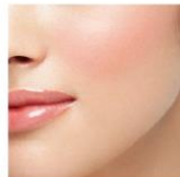
RD-01 〈仕上がりイメージ〉