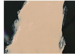
顔料を分散させた超高粘度油剤をのばした様子

顔料の分散性が高く、高密度な超高粘度油剤を採用し、凹凸感のある肌にもなめらかにのびて、ぴったりとしたフィット感のある仕上がりを実現しました。