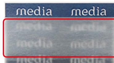
カバー素材を塗布した様子