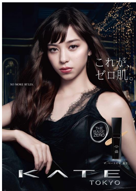
THE BASE ZERO ポスタービジュアル

【その他】 第28回ベストジュエリードレッサー賞 (10代部門受賞) 第71回毎日映画コンクール授賞 (新人賞)