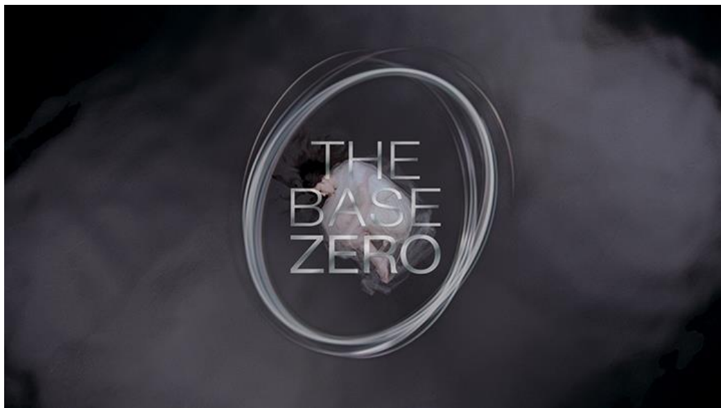
新ベースメイクシリーズ「THE BASE ZERO」のイメージキャラクター 中条あやみさん登場の新TV-CM

中条あやみさんが登場する新しいTV-CMは、水の世界で表現される少女のような中条さんが、ファンデーションでメイクアップをして大人の女性へと変わっていくというストーリーで、新商品の「誕生」と、KATEらしい「美」を表現しています。ぜひご注目下さい。