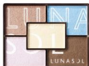
<EX02> Cool Sunny Collection 透明感のあるパープルやブルーがモードで涼しげな目もとを演出するクールサニーコレクション