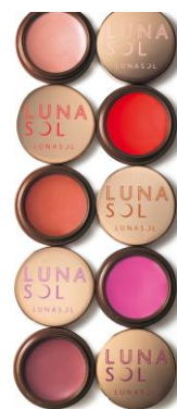
<EX01> Shiny Beige ヌーディなピンクベージュにプリズムの光が繊細にきらめくシャイニーベージュ