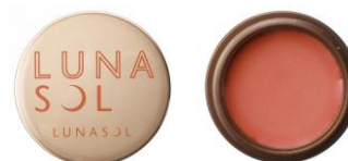
<EX05> Cassis Mauve クールで洗練された大人の表情を生み出すカシスモーヴ