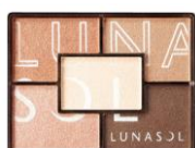
<EX01> Spicy Sunny Collection 夏らしいオレンジベージュが大人の目もとをモードに彩るスパイシーサニーコレクション