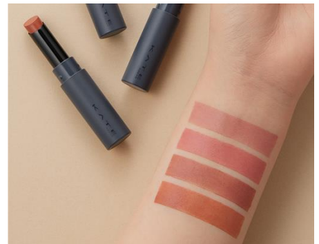
全て仕上がりイメージ