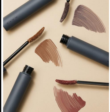
全て仕上がりイメージ