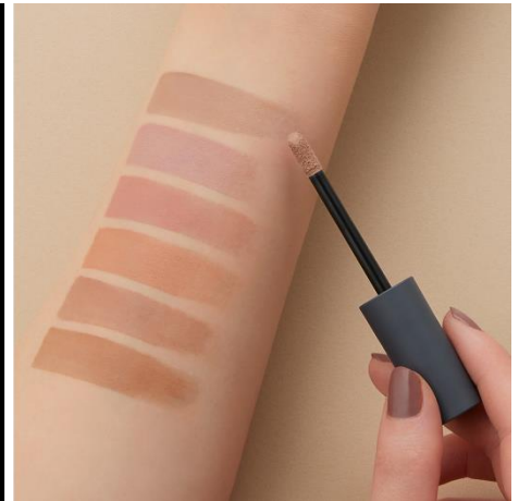
全て仕上がりイメージ