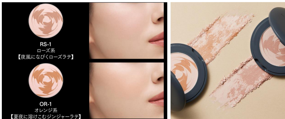
全て仕上がりイメージ