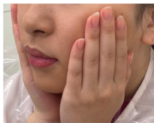
トワニーアンドミー デュアルウォッシュハグ 塗布