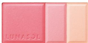
02 Rose Pink やわらかくフェミニンな印象のローズピンク