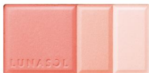
01 Beige Red 肌になじみながら自然な血色感を与えるベージュレッド