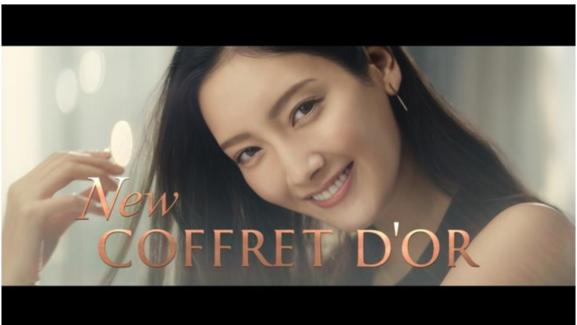
新イメージキャラクター 菜々緒さん初登場のTV-CM「18春ヌーディカバーパクト 15秒篇」

菜々緒さんが登場する新しいTV-CMは、美しい肌の仕上がりや目もとの立体美を魅せることに、とことんこだわった映像表現で描いています。菜々緒さんの“ハンサム・ビューティ”な表情に、ぜひご注目下さい。