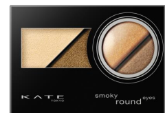
OR-1 エネルギッシュな ブライトオレンジ