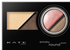
PK-1 上品なフェミニンピンク