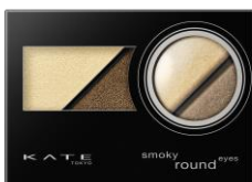
BR-1 スタイルッシュなダークブラウン