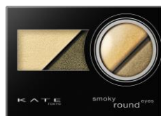
GN-1 シックなディープカーキ