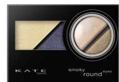
BU-1 モードなダークネイビー