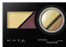
RD-1 印象的なエレガントレッド