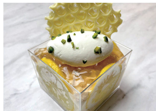
生ティラミス 『はちみつレモン』 ¥930

ほんのり甘いゼリーと、たっぷりのいちごをトッピングした生ティラミス『いちご』 抹茶を浸ませたスポンジ、濃いめの抹茶ゼリー、あずきをしのばせた生ティラミス『宇治抹茶』 甘酸っぱいレモンゼリーに、生クリーム、ピスタチオ、蜂の巣に見立てたホワイトチョコレートをトッピングした生ティラミス『はちみつレモン』 ブルーベリーピューレを浸ませたスポンジに、カリカリのクランブル、ブルーベリーと生クリームを盛り付けた、見た目も可愛い生ティラミス『ブルーベリー』 表面をブリュレしてカリカリにしたバナナとチョコレートチップ、キャラメリゼナッツをトッピングした生ティラミス『ブリュレバナナとチョコレートナッツ』 など…フレッシュチーズを使用したスイーツが新たにラインナップ！！