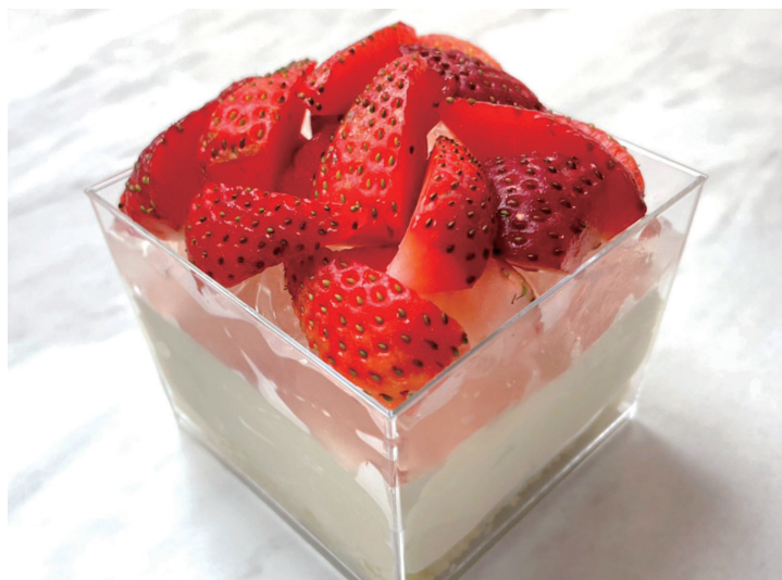
生ティラミス 『いちご』 ¥950

株式会社 LIFEstyle (本社：大阪市北区) は 『CHEESE CRAFT WORKS』 にて、フレッシュチーズを使用したとろとろ食感が楽しい 『生ティラミス』 の販売を開始いたします！