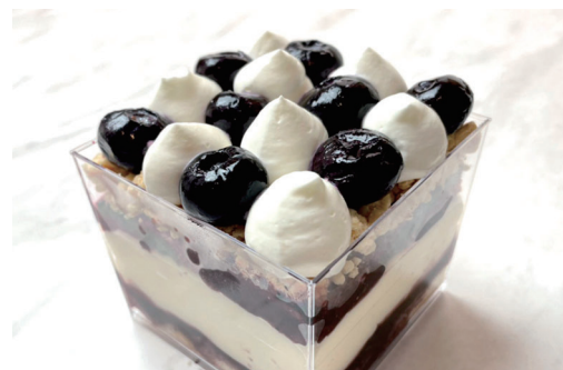
生ティラミス 『ブルーベリー』 ¥800