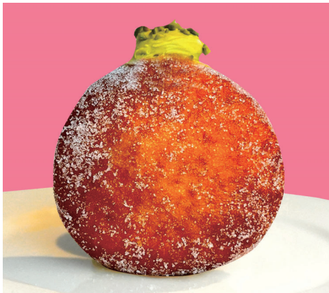
ピスタチオ ～ピスタチオ × 生クリーム～¥450

ご注文頂いてからフレッシュなクリームを絞る出来立ての生ドーナツ。美味しく食べていただける賞味期限は1時間程なのでお早めにお召し上がりください♪