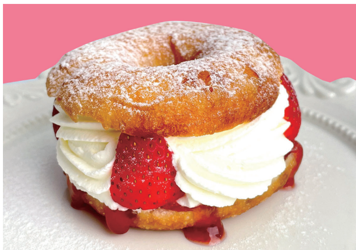
いちごとカスタード ¥650

株式会社 LIFEstyle (本社: 大阪市北区) は 新食感!! 生ドーナツ専門店『DONNA donut (ドンナドーナツ) 梅田』 を 9月23日(金) グランドオープン いたします!