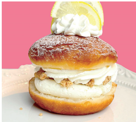
レアチーズケーキ ¥650