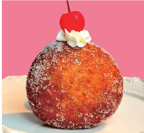
カスタード ～カスタード × 生クリーム～¥400