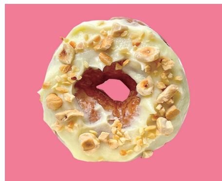
シナモンドー Nuts ¥380

テイクアウトはもちろん! 当店2階の千成屋珈琲では『 DONNA donut (ドンナドーナツ) 』のイートイン限定メニューをご提供! いちごのミルフィーユをドーナツで再現した『 いちごとカスタード 』自家製のレモンカスタードクリームに、たっぷりのメレンゲをのせブリュレし、仕上げにレモンの皮を削りトッピングした『 レモンメレンゲ 』などなど…是非ご賞味ください!