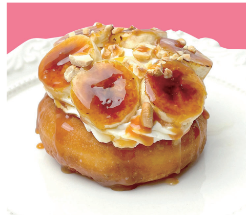
ブリュレバナナとキャラメルナッツ ¥600