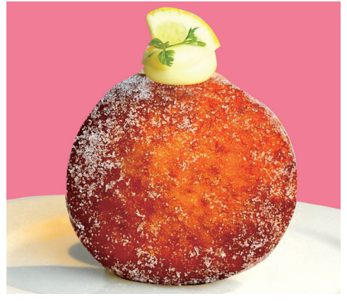
生レモン ～レモンカスタード × 生クリーム～¥400