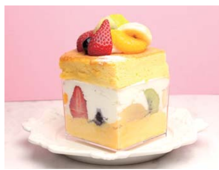
台湾カステラショートケーキ ¥680 ミックスフルーツ 《イートイン》