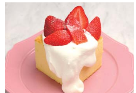
台湾カステラデコケーキ ¥630 たっぷりいちご 《イートイン》