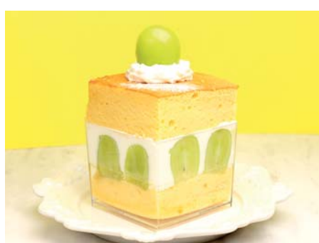
台湾カステラショートケーキ ¥980 シャインマスカット 《イートイン》