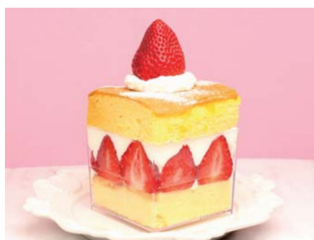
台湾カステラショートケーキ ¥780 いちご 《イートイン》