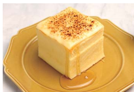
台湾カステラデコケーキ ¥580 ブリュレチーズ 《イートイン》