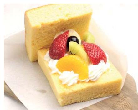
食べ歩き 台湾カステラバーガー ミックスフルーツ 《テイクアウト》 ¥480