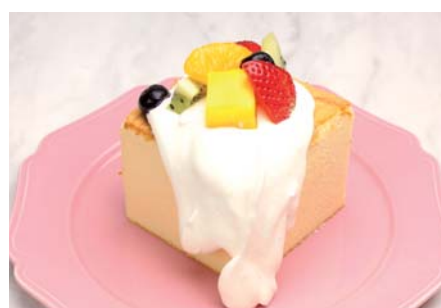
台湾カステラデコケーキ ¥580 ミックスフルーツ 《イートイン》