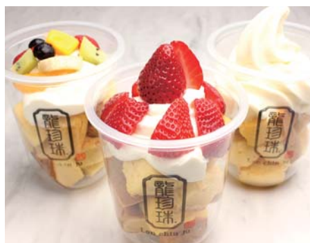
食べ歩き 台湾カステラ CUP 《テイクアウト》 ¥380～