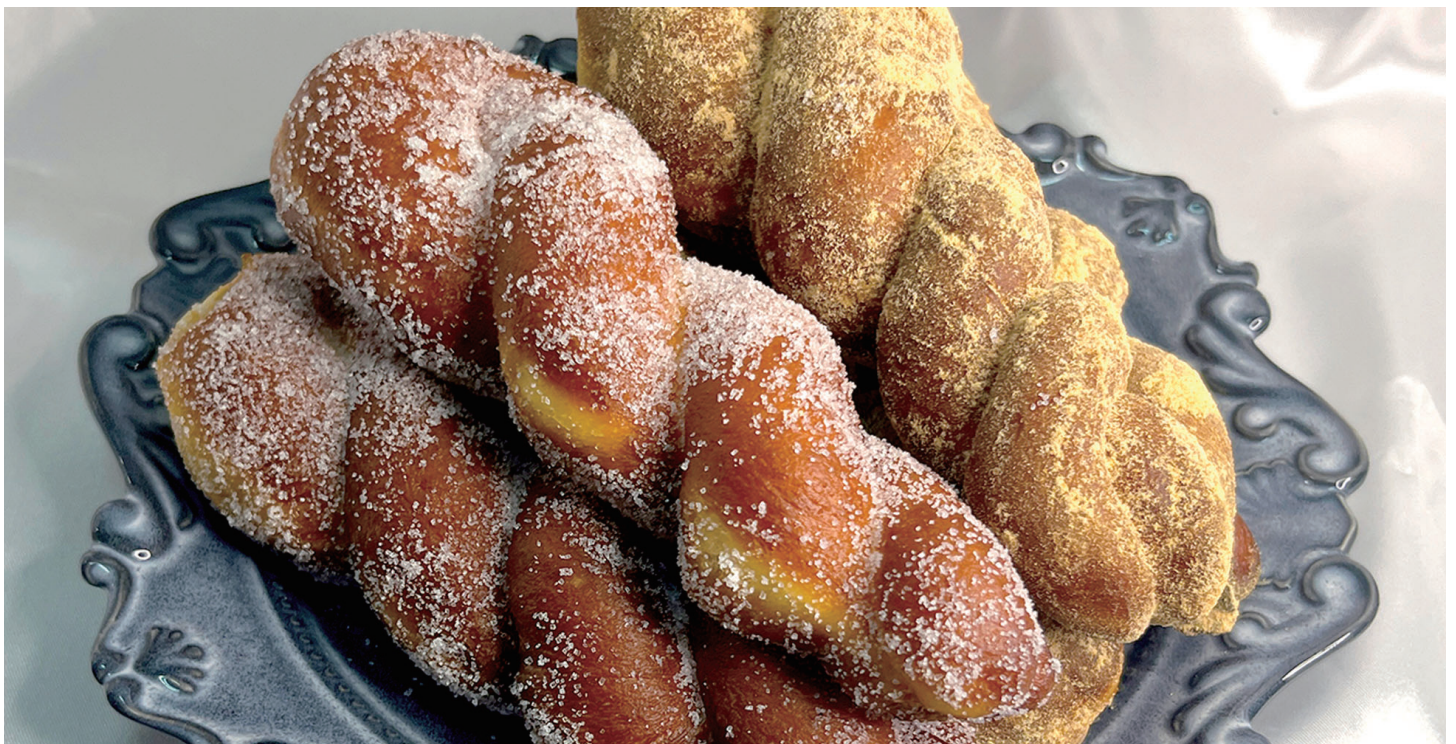
レトロツイストドーナツ プレーン ¥300

株式会社 LIFEstyle (本社：大阪市北区) は『DONNA donut (ドンナドーナツ) 梅田』にて 揚げたてサクサクふわもちの『レトロツイストドーナツ』 & 『ミニレトロドーナツ』が新登場！