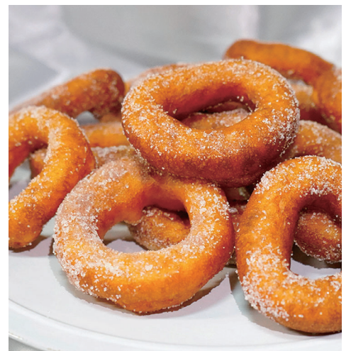
ミニレトロドーナツ (5個入り) ¥500

そのほかにも生ドーナツ生地の製造工程を工夫し、レトロなシュガードーナツ風に仕上げた『ミニレトロドーナツ』サイズが小さめなので歩きながらのちょっとしたおやつにも最適。1日2回、揚げたてを数量限定で販売します！是非一度、揚げたてサクサクふわもちの新作ドーナツをご賞味ください♪