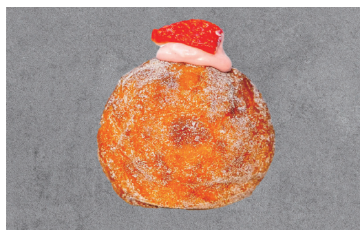
【生ドーナツ】ストロベリーチーズケーキ ～レアチーズクリーム～¥430

65%のハイカカオチョコレートと牛乳に浸したフィンガークッキーに、自家製のティラミスクリーム、いちごのチーズクリーム、新鮮ないちごをトッピングした『いちごとチョコレートのティラミス』チョコレートソースや自家製のいちごゼリー、ティラミスクリームなどを丁寧に組み立てたパフェに、薄いお餅を敷き、いちごのモンブランペーストを絞り、フレッシュないちごをトッピング!いちご大福とティラミスがコラボレーションしたような『いちご大福ティラミスパフェ』サクサクのパイ生地をいちごのクリームで包み込み新鮮ないちごをたっぷりとトッピングした『いちごのミルフィーユ』自家製のレアチーズクリームにいちごソースを混ぜ込んだ、いちごの酸味とクリームチーズのリッチな甘さが相性抜群の『ストロベリーチーズケーキ生ドーナツ』いちごの果肉とフレッシュな生クリームをたっぷりと混ぜ込んだ『いちごの自家製ジェラート』などなど…みんな大好きないちごを贅沢に使用したストロベリーフェスを是非ご堪能ください!