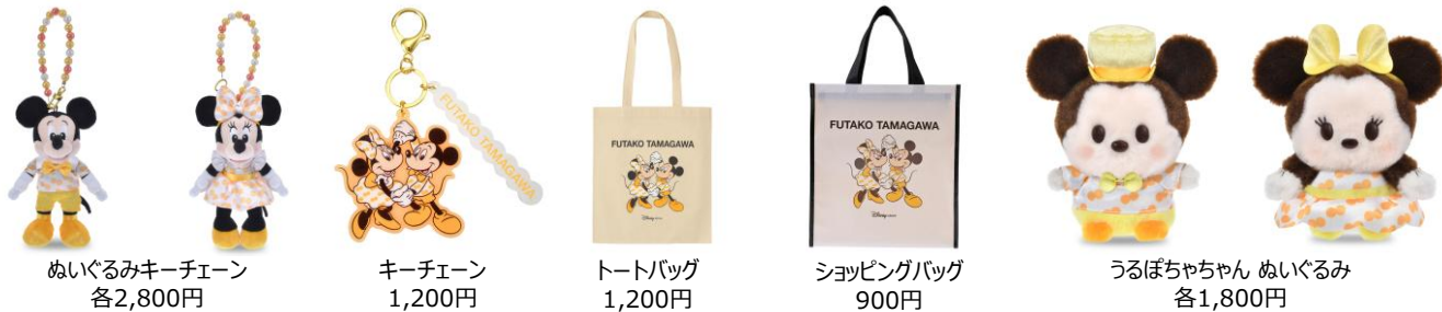
ぬいぐるみキーチェーン 各2,800円