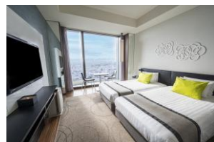
スーペリアツイン