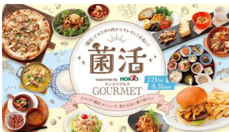
『ホクト』とのコラボグルメフェア「菌活GOURMET」