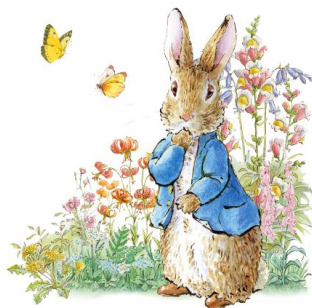
作者の生誕160周年を記念した「フラワーギフト&グリーティング」