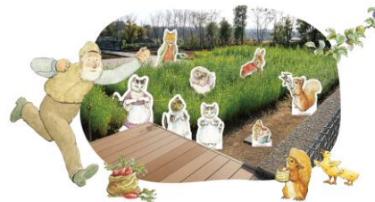
1日限定で絵本の世界観を体感できる「菜園体験inマグレガーおじさんの畑」