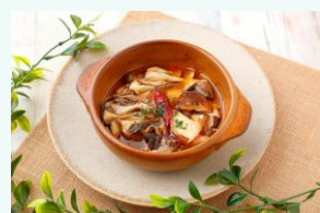
6種きのこのアヒージョ