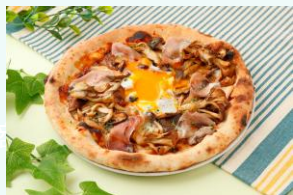
フンギ ビスマルク