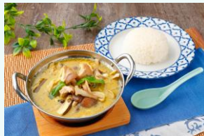
4種きのこのグリーンカレー