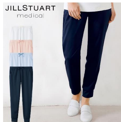
スクラブパンツ : 4サイズ 価格 : 5,940 円(税込) 素材 : アスレジャー