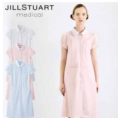
ワンピース : 4サイズ 価格 : 8,532 円(税込) 素材 : コードストライプ