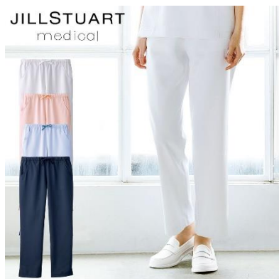
パンツ : 4サイズ 価格 : 5,940 円(税込) 素材 : ダイアゴナル