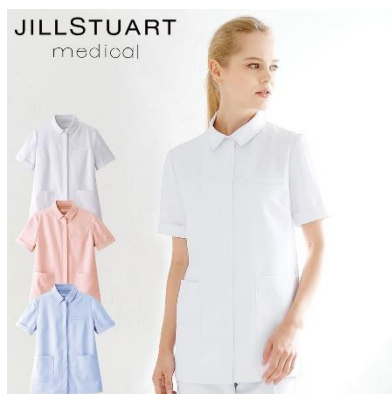
ジャケット : 4サイズ 価格 : 7,452 円(税込) 素材 : ダイアゴナル