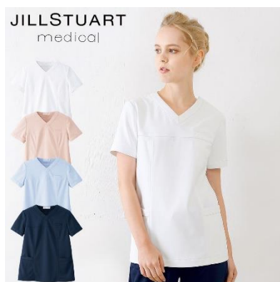
スクラブ : 4サイズ 価格 : 6,372 円(税込) 素材 : アスレジャー