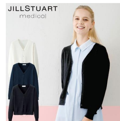
カーディガン : 4サイズ 価格 : 5,292 円(税込) 素材 : 綿混ニット