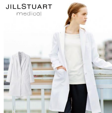
ドクターコート : 4サイズ 価格 : 9,612 円(税込) 素材 : ダイアゴナル