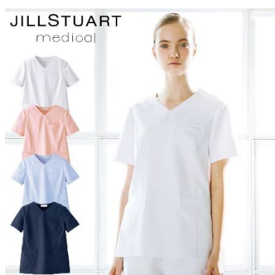
スクラブ : 4サイズ 価格 : 6,372 円(税込) 素材 : ダイアゴナル