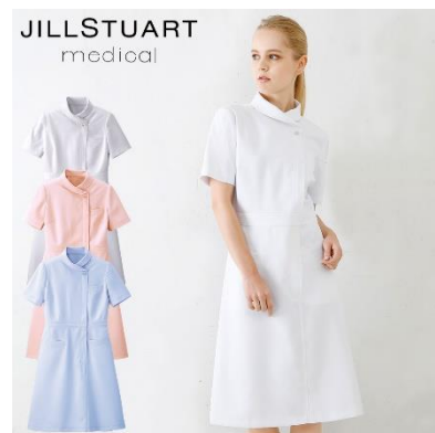
ワンピース : 4サイズ 価格 : 8,532 円(税込) 素材 : ダイアゴナル