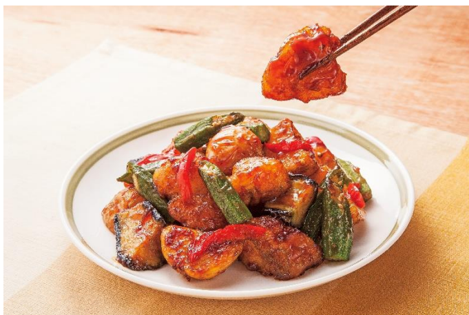
<いつでも超速10分おかず kit>毎月4,980円(税抜) 調理イメージ

株式会社ベルーナ(本社：埼玉県上尾市、代表：安野清)が展開するグルメ専門通販「ベルーナグルメ友の会」( https://belluna-gourmet.com/ )は料理キットブランド「NICOMOG (にこもぐ)」を設立。春号にて冷凍料理キット「いつでも超速10分おかず kit」を発売いたしました。