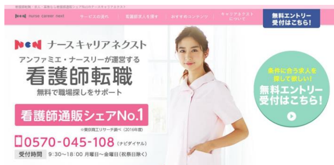
<ナースキャリアネクスト サイト>