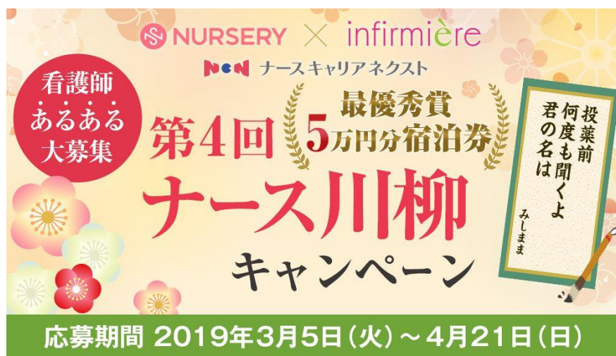
<看護の日応援>最大5万円分の宿泊券プレゼント！「ナース川柳」キャンペーン

株式会社ベルーナ（本社：埼玉県上尾市、代表取締役社長：安野 清）の子会社である株式会社ナースステージ（ https://www.nursestage.co.jp ）の看護師向け通販ブランド「アンファミエ」（ https://www.infirmiere.co.jp/ ）と「ナースリー」（ https://www.nursery.co.jp/ ）、看護師の人材紹介事業「ナースキャリアネクスト」（ https://career-next.jp/ ）は、5月12日の「看護の日」を記念して、『<看護の日応援>最大5万円分の宿泊券プレゼント！第4回「ナース川柳」キャンペーン』を3月5日から実施いたします。