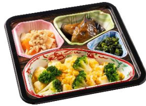
⑧豆腐とブロッコリーのかにたまあんセット