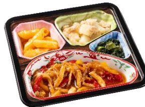
⑤チンジャオロースセット