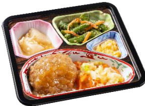
⑦ハンバーグの和風オニオンソースセット