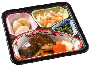
③カレーの煮付けセット