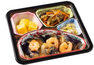
⑥海老となすの味噌セット