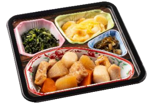
②鶏肉と野菜のお煮しめセット