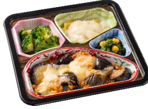
④なすのグラタンセット