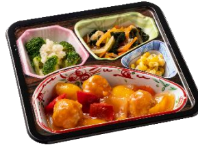
①肉団子の甘酢あんかけセット