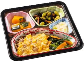
⑨牛肉とほうれん草のとろっと卵セット