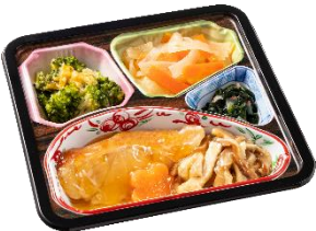
⑩赤魚の照り煮セット