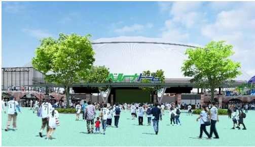
ベルーナドーム外観 イメージ