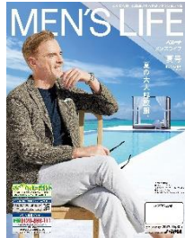
メンズライフ夏号