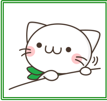
公式キャラクター「べるーにゃ」