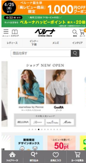
ベルーナネット (PCサイト・スマートフォンサイト)