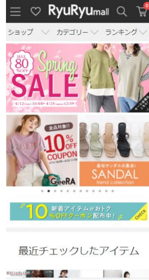
RyuRyumall (PCサイト・スマートフォンサイト)