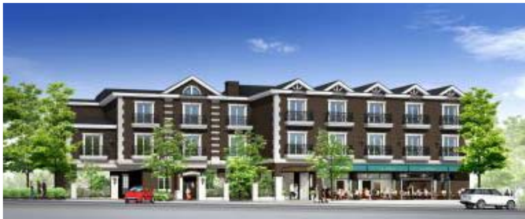
「ルグラン軽井沢」 外観