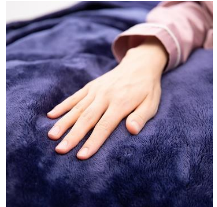
肌ざわりの良いマイクロファイバー