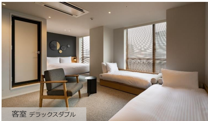
客室 デラックスダブル