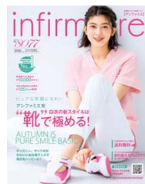
<アンファミエ 2016 秋>