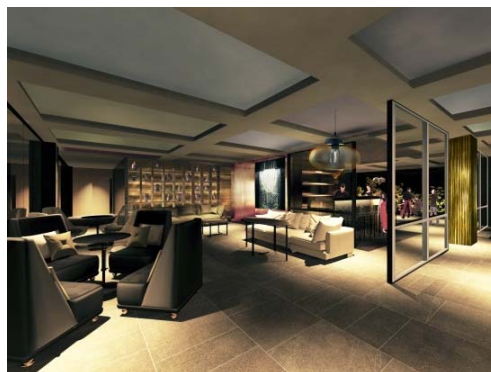
<レストラン・バー・ラウンジ>

半地下のエントランス空間は、フロント、ラウンジ、バー、レストランが繋がり、中庭と一体の空間を構成。様々な国のお客様が思い思いの過ごし方で出会い、またコミュニケーションが生まれるような空間にしています。