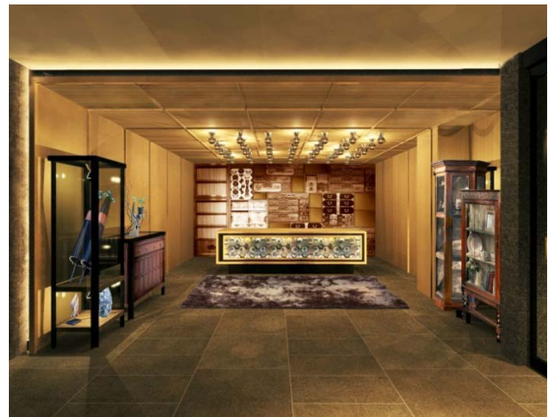
<京都グランベルホテル フロント>

京都への観光客数は年々増加しており、2015年は観光客数が5,684万人、宿泊客数は1,362万人とともに過去最高を記録しております。また外国人宿泊客数も前年より72.8%増と大幅に増加し、日本の訪日外客数の伸び率47.2%を上回るほど、京都のインバウンド需要は高まっています。(※「京都観光総合調査2015年」より)