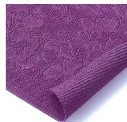
<パイル生地 拡大画像>