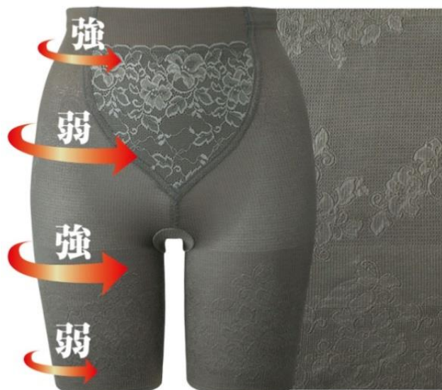
<生地の締め付け強弱でサポート イメージ図>

『エステのように包み込むガードル』は、きつく締め付けることで補整するパワーネットを一切使わず、生地の編み方で圧力を変え、引き上げてサポートすることを実現させた新発想のアイテムです。