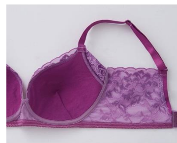
<サイドベルト 段階着圧オリジナルレース>