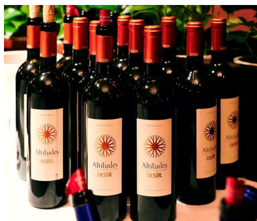
＜当日振舞われた「IXSIR」ワイン＞

現在約2,700種類のワインを扱っている「My Wine CLUB」では、この度新しくレバノンワイン「IXSIR」の取扱いを開始しました。そこで、より多くの日本の方に「IXSIR」の魅力をお伝えするため、ワイナリー代表ディバネ氏と出資者であるカルロス・ゴーン氏と共に記念パーティーを開催しました。