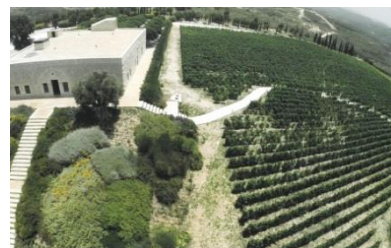
<生産地 ベッカー高原>