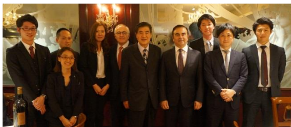
< My Wine CLUB のメンバーと集合写真 >