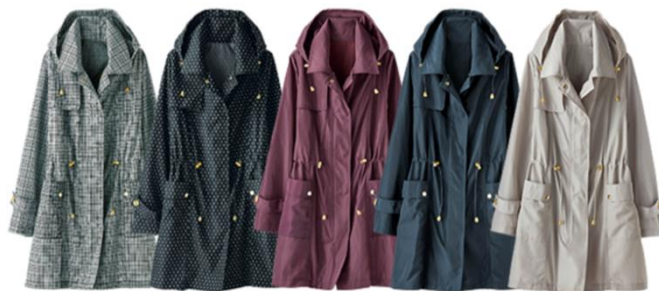
＜グレンチェック、ドット、ワイン、ネイビー、ライトグレー＞

商品名 : 雨の日もおしゃれに！はっ水加工コート サイズ/価格 : M~LL 3,990 円(税別) 3L~4L 4,990 円(税別) 色 : グレンチェック、ドット、ワイン、ネイビー、ライトグレー 特長 : 雨の日にも大活躍する、はっ水加工を施したコート。 トレンド感漂う、ゴールドジッパー使いがポイントです。 デザイン性と機能性を兼ね備えた優秀コート。背裏部分が メッシュ素材になっており、蒸れにくいのも魅力。