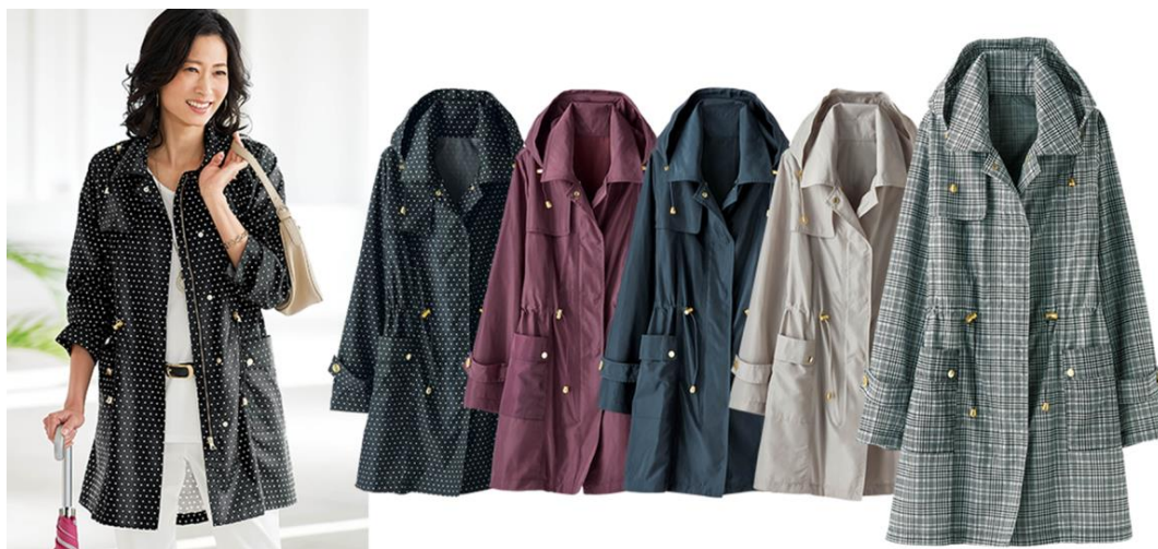
<雨の日もおしゃれに！はっ水加工コート>3,990円(税別)～

株式会社ベルーナ(本社:埼玉県上尾市/代表:安野 清)が展開する大人の女性向け通販ブランド「BELLUNA(ベルーナ)」( https://belluna.jp/ )は、はっ水加工を施した「雨の日もおしゃれに！はっ水加工コート」を発売しました。