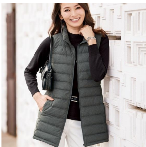
<軽量ダウンロングベスト> 3,490 円（税別）～

株式会社ベルーナ（本社：埼玉県上尾市／代表：安野 清）が展開する大人の女性向け通販ブランド「BELLUNA（ベルーナ）」（ https://belluna.jp/ ）は、腰まわりまでのロング丈でありながらすっきりとしたシルエットの「軽量ダウンロングベスト」を発売しました。