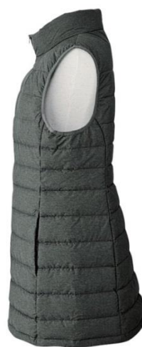
<サイドの切替ですっきり設計>

BELLUNA 最新の秋冬号では「カジュアルリッチスタイル」をテーマに、新商品を掲載しています。ロングベストは袖のあるコートやジャケットと比較し、体温調整がしやすく気になる腰まわりをさりげなく体型カバー。