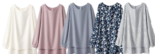
<「ティアードデザイン」白・ローズ・サックス・花柄・ストライプ>