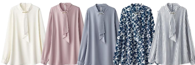
<「ボウタイデザイン」白・ローズ・サックス・花柄・ストライプ>