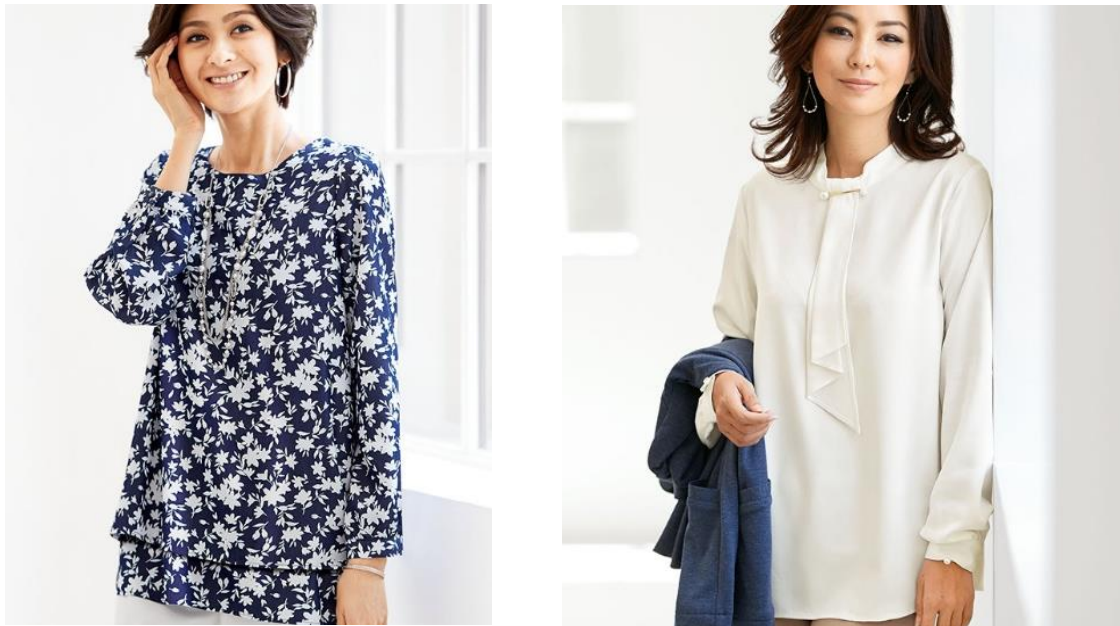
<華やかさを演出するティアードデザイン>