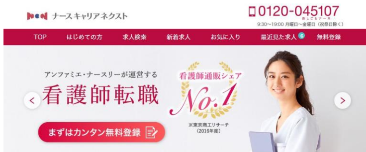
<ナースキャリアネクスト サイト>