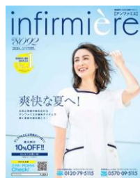
<アンファミエ夏号>