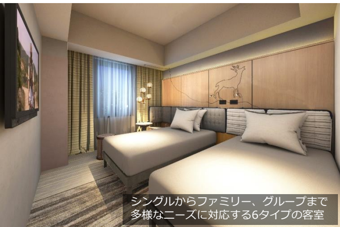
シングルからファミリー、グループまで 多様なニーズに対応する6タイプの客室

すすきの駅から徒歩8分の場所に位置しており、札幌の観光名所「時計台」「テレビ塔」「赤レンガ」も徒歩圏内にあるため出張などのビジネス利用だけでなく、観光の拠点としても最適です。客室はダブルルームから4名様利用可能なファミリータイプまで全6タイプの客室をご用意。最上階13階にある天空露天風呂では星空を眺めながらくつろぎのひと時をお過ごしいただけます。