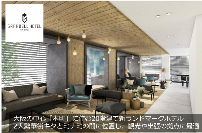
大阪の中心「本町」に佇む20階建て新ランドマークホテル 2大繁華街キタとミナミの間に位置し、観光や出張の拠点に最適