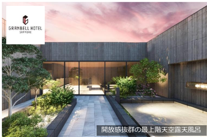
開放感抜群の最上階天空露天風呂