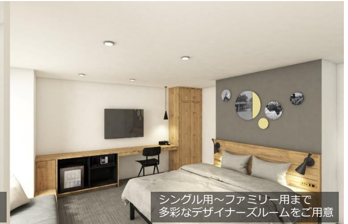
シングル用~ファミリー用まで 多彩なデザイナーズルームをご用意

大阪の中心「本町」にたたずむ地上20階建ての新ランドマークホテルです。2大繁華街として有名なキタ（梅田）とミナミ（なんば・心斎橋）の間に位置しており、観光や出張の拠点に最適です。客室はシングルルームから4名様利用可能なファミリータイプまで全7タイプの客室をご用意。19階の大浴場や最上階20階にあるルーフトップバーでは大阪の夜景を眺めながらゆったりとした時間をお楽しみいただけます。