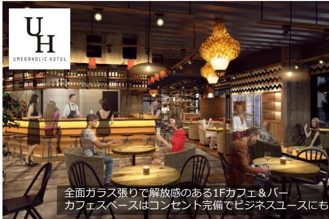
全面ガラス張りで解放感のある1Fカフェ&バー カフェスペースはコンセント完備でビジネスユースにも