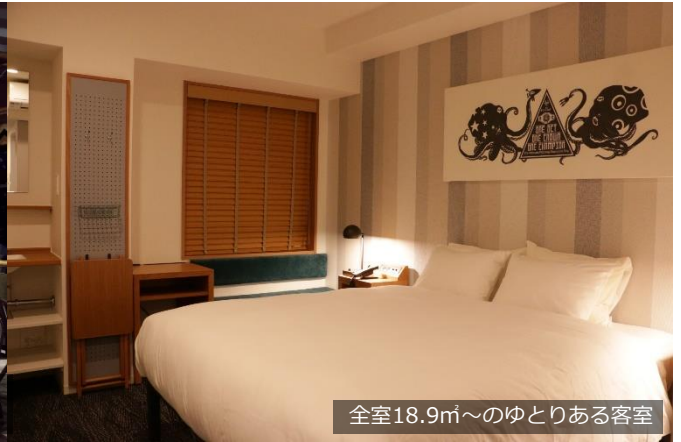
全室18.9㎡~のゆとりある客室

機能性を備えた客室は全室18.9㎡~でゆとりのある全3タイプをご用意。1Fに併設されているガラス張りで開放的なカフェ&BARは個性豊かなインテリアに囲まれてくつろぎの時間をお過ごしいただけます。カフェスペースには席ごとにコンセントを完備しており、パソコン作業等をしながらのビジネス利用も可能です。