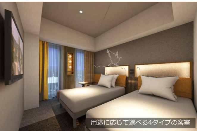
用途に応じて選べる4タイプの客室

繁華街まですぐの好立地にある全300室のエリア最大級ホテル。客室は全部屋17.9㎡以上の4タイプでゆったりとお過ごしいただけます。最上階17階の絶景展望風呂からは、札幌の街を眺めながら心休まるひと時をお過ごしいただけます。レストランやバー、フィットネスジムを完備しており、客室以外の館内施設でもお楽しみいただけます。