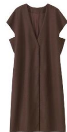
ボックスシルエット

ベルーナでは、“お客様の衣食住遊を豊かにする商品やサービスの提供”という経営理念の下、お客様へより時代を捉えた多彩な商品やサービスを今後も提供し続けてまいります。