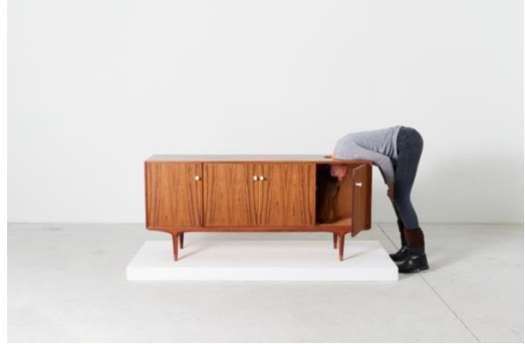
エルヴィン・ヴルム《Head TV》2017年 © Erwin Wurm, JASPAR, Tokyo 2026, Courtesy the artist and Lehmann Maupin, New York, Seoul, and London. Photographer: Eva