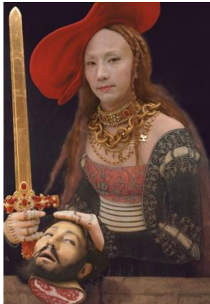
森村泰昌《Mother (Judith I)》1991年 © Yasumasa Morimura, Courtesy of MEM

本章では、アーティスト一人ひとりの表現世界と深く静かに向き合います。国内外で活躍する日本を代表するアーティスト—奈良美智、村上隆、草間彌生、加藤泉、塩田千春、森村泰昌、大竹伸朗、空山基、鴻池朋子、鈴木ヒラク、しまうちみか—の作品を紹介します。