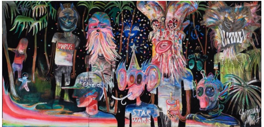
しまうちみか《私たちは最高/we are on fire》2023年 © Mika Shimauchi